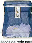
Nos sacos de rede para coleta

Bandejas de isopor utilizados para colocar alimentos tais como: carne, peixes; isopores utilizados para embalagens (as coloridas também podem ser jogadas juntas)