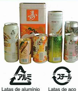
Latas de alumínio Latas de aço