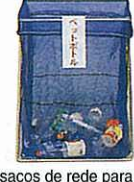
Nos sacos de rede para coleta.

Garrafas PET de bebidas como: sucos, chá, sakê; garrafas PET de shoyu, mirin (adoçante feito do sakê) (Aqueles que têm a marca PET 1)